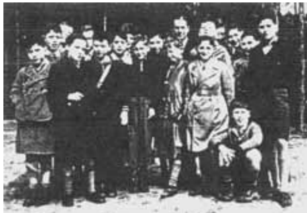
Zickel-Schüler bei einem Ausflug, 1938