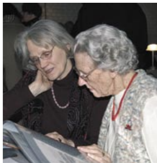
Besucherinnen beim Lesen eines biografischen Albums