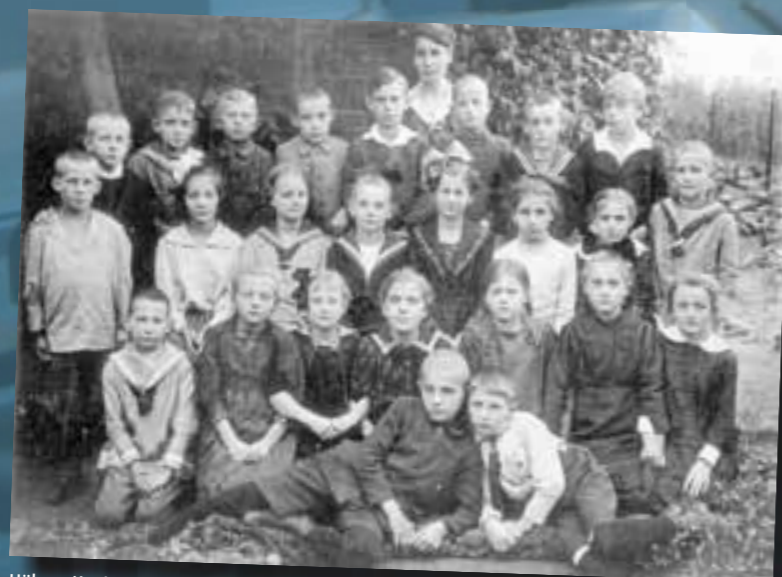
Höhere Knaben- u. Mädchenschule Lichtenrade um 1920. Aus dem Album Familie Freudenfels (heute: Ulrich-von-Hutten-Oberschule)