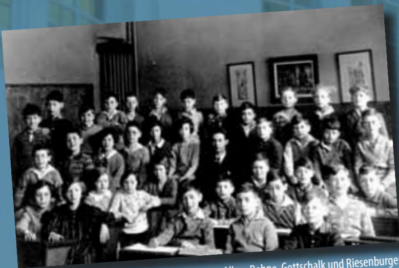
14. Gemeindeschule, Februar 1930. (heute: Löcknitzschule)