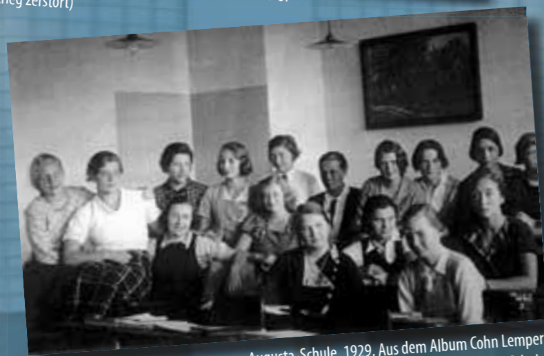
Augusta-Schule, 1929. Aus dem Album Cohn Lempert (heute: Sophie-Scholl-Schule)