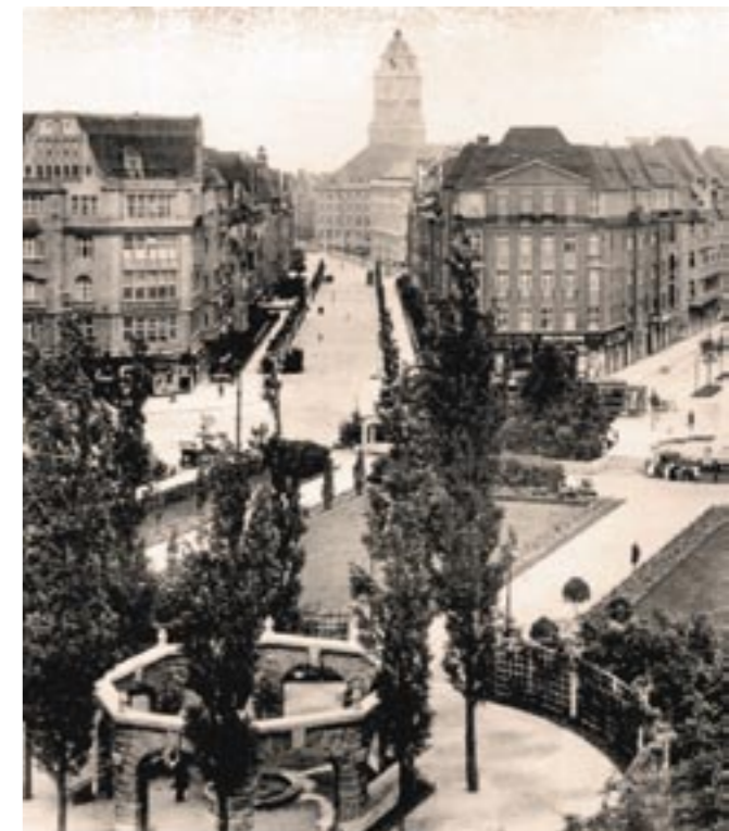
Der Bayerische Platz, das Zentrum des Bayerischen Viertels im Jahr 1939. Im Hintergrund der alte Turm des Schöneberger Rathauses, im Vordergrund das steinerne Oktogon.

The exhibition „Wir waren Nachbarn“ (We were neighbours) will open on occasion of the International Holocaust Remembrance Day at Schöneberg townhall on January 24th and will then be shown permanently. Daily opening hours are 10 am to 6 pm, closed on Fridays. Admission is free. The core of the exhibition is a collection of 131 family albums of former Jewish neighbours from the „Bayerisches Viertel“ (Bavarian quarter) and the entire district of Tempelhof-Schöneberg. Containing pictures, documents and reports these albums present an idea of life in Berlin before 1933 and the gradual steps of „isolation and deprivation of rights, expulsion, deportation and murder of Berlin Jews from 1933 to 1945“. This is also the name of the unique memorial by the artists Renata Stih and Frieder Schnock in the „Bayerische Viertel“, directly neighbouring Schöneberg townhall.