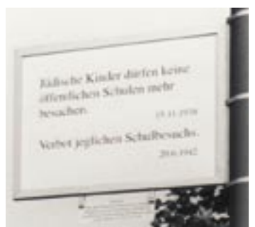
Vorder- und Rückseite einer Tafel aus dem 80-teiligen Denkmal der Künstler Stih/Schnock im Bayerischen Viertel.

Anmeldung und Information für den Besuch von Gruppen und Schulklassen (auch am Freitag) Kunstamt: (030) 90277-6964 Rollstuhlfahrer/-innen bitte anmelden hausamkleistpark-berlin@t-online.de www.hausamkleistpark-berlin.de