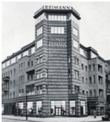
Die Reimann-Schule 1932 in der Landshuter Straße 38, nach Umbau und Erweiterung durch zwei aufgesetzte Stockwerke

Hier, in diesem Raum, hat sich eine vielstimmige Erzählung eingeschrieben, entstanden in intensiver Zusammenarbeit mit Zeitzeuginnen und Zeitzeugen und ihren Nachkommen. Zu diesen gelebten Leben gehören aber auch die Erfahrungen von Ausgrenzung, Verfolgung, Entwürdigung und die Vertreibung und Ermordung von Familienangehörigen.