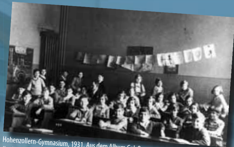
Hohenzollern-Gymnasium, 1931. Aus dem Album Gal-Or (im Krieg zerstört)